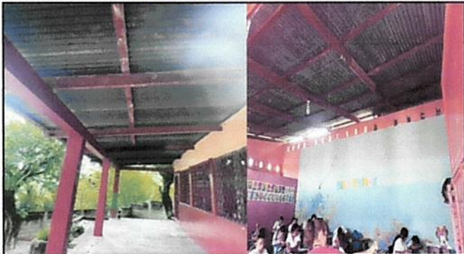
Foto1: CAMBIO DE TECHO MODULO 1