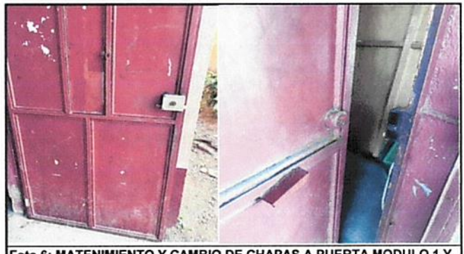
Foto 6: MATENIMIENTO Y CAMBIO DE CHAPAS A PUERTA MODULO 1 Y MODULO 2

Observación: Si es necesario se pueden agregar hojas adicionales y actualizar el número de hojas.